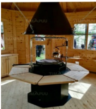
Polar Grill L8